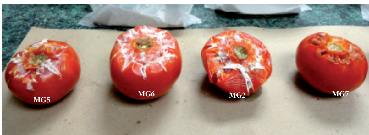
Figura 2. Evaluación de los daños ocasionados por diferentes cepas de G. candidum en tomate rojo. Se observa la presencia de micelio y ablandamiento en los frutos.

attack on hyphae and the competition for nutrients (Chanchaichaovivat et al. , 2008; Nantawanit et al. , 2010; Scherm et al. , 2003). This diversity in mechanisms represents a diverse interval of antagonistic capabilities for the killer yeasts with plant pathogenic fungi, with the possibility